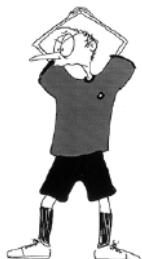
914 Beträdande av målvaktsområde