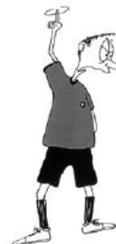
925 Olämpligt uppträdande